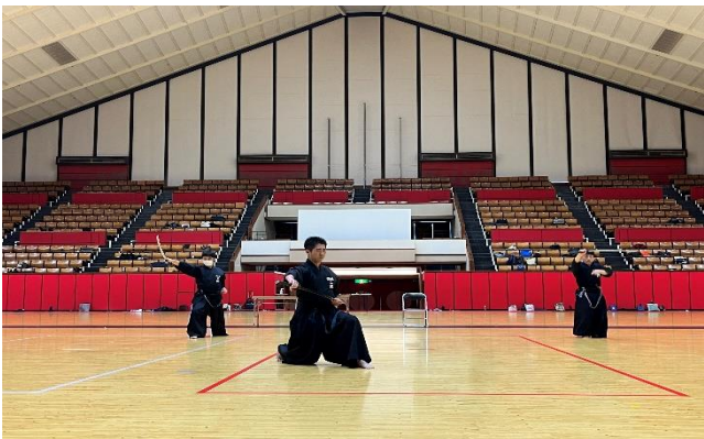
三段から五段の演武ご協力の皆様