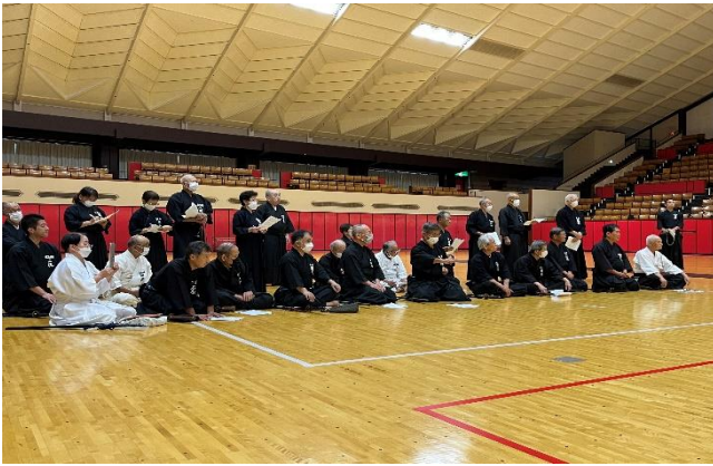
全剣連居合実技講習 一1

上たはか し則 平三 露した代 げだ、ら今ま(宮野、選表 まき積五回した(城政弘、手選 すま極段、た)粹。を)で・審判 。した的の審。を)行山判法 。演十七講習会に全つた明講 心武の七名会に配判正・伊 からご協の皆加のし則藤講 感謝力様への三実・政師 申しをに段施細敏・ 午後 の始 びに 関東 甲全 行信 わ越 れ大 会